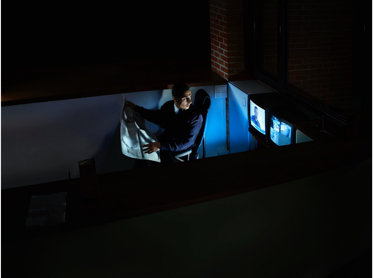
Night watcher, 2008.