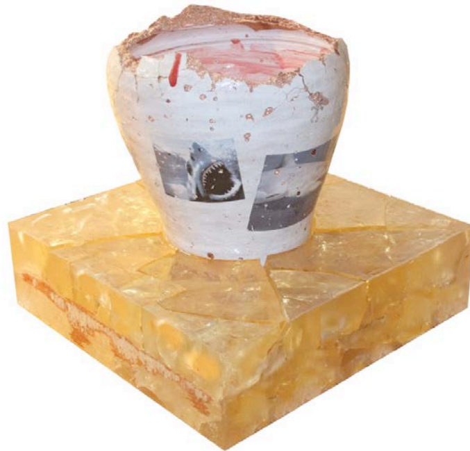
Jaws , 2013.

Rayogramme de bananes et négatif papier, Procédé Cyanotype sur papier Arches 75 x 105 cm